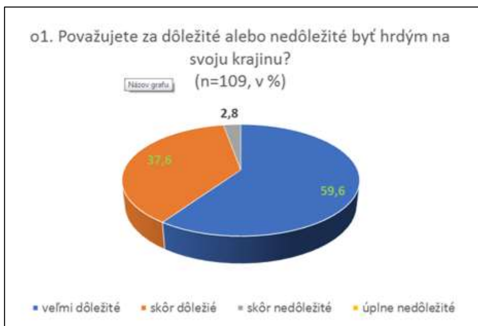
Obrázok 1: Výsledky prieskumu

Vzhľadom na fakt, že fenomén vlastenectva je spojený s emočnou stránkou, teda pocitmi hrdosti na svoju krajinu, u respondentov bolo zisťované do akej miery považujú tento pocit za dôležitý. Drvivá väčšina respondentov (97,2 %) pokladá za veľmi dôležité alebo skôr dôležité prechovávať hrdosť na svoju krajinu.